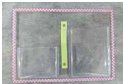
セット商品完成例 2