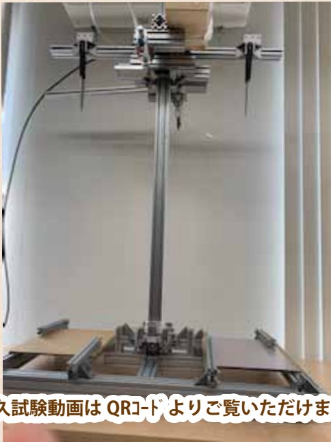
耐久試験動画はQRコードよりご覧いただけます。

ポリカーボネートの耐久試験 ※3kgの重りを付けたナイフを720mm落下しました。