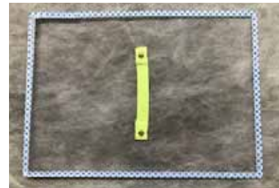
ボード単体完成例

こちらの製品はネット販売しております。 詳細に関しては「 防犯対策 ないよりましボード 」 又は「 搬送楽店 ないよりましボード 」で検索を 頂くか右側の QR コードよりご確認ください。