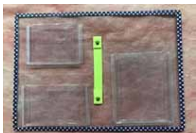
セット商品完成例 1